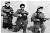
Des Moudjahidates 15

Les femmes algériennes sont toujours sous le poids des traditions patriarcales et celles-ci sont malheureusement toujours gravées dans la loi. On peut donc parler de « violence légale » puisque celles-ci sont loin d'instaurer une égalité entre les deux sexes et institutionnalise la minorité à vie de la femme. Ces lois sont rassemblées dans le « code de la famille ». Il fut adopté le 9 juin 1984 par l'assemblée populaire algérienne par une composante essentiellement masculine malgré l'opposition des nombreuses femmes, en particulier des résistantes -les moudjahidates - qui avaient participé à la libération du pays et plaidaient pour une égalité des sexes. 14