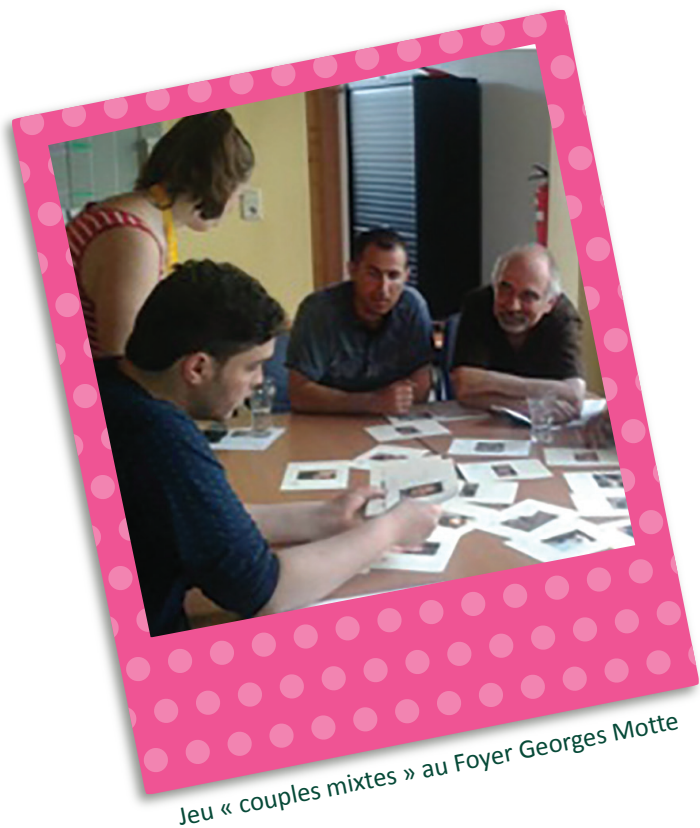
Jeu « couples mixtes » au Foyer Georges Motte